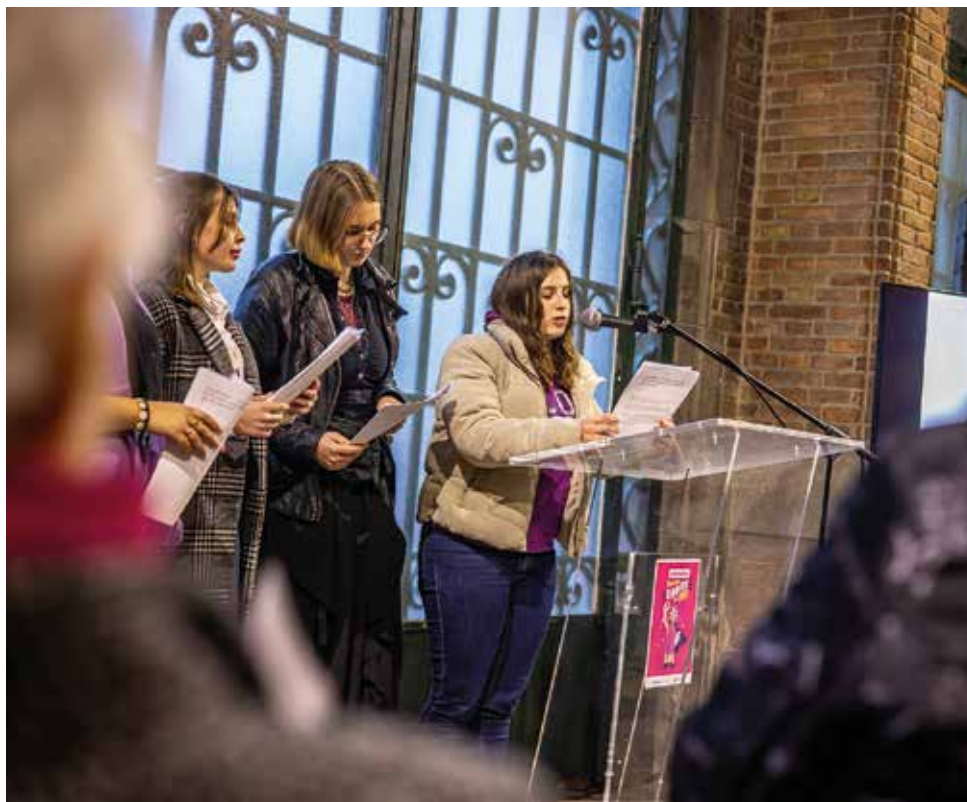
Yes we cause. Dans le cadre du mois des droits des femmes, plusieurs rendez-vous invitaient le public à se mobiliser pour l'égalité entre les femmes et les hommes, dont un temps de paroles « Yes we cause ».