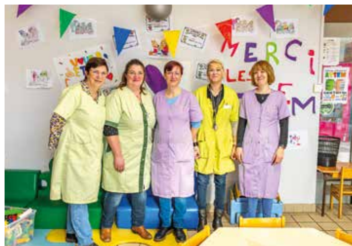
Les ATSEM à l'honneur. Le 23 mars, nous fêtons les ATSEM, une journée spéciale pour les remercier pour leur engagement et leur dévouement auprès des enfants.