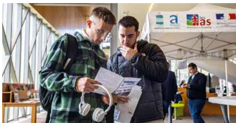
Yadutaf pour tous. Le 17 avril, des chercheurs(euses) d'emploi avaient l'occasion de rencontrer des recruteurs en direct de la Médiathèque lors de la 3 e édition de Yadutaf pour tous.