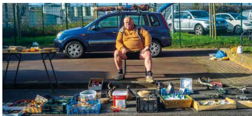
Le temps des brocantes. Le téméraire Comité Saint-Roch officialisait le retour de la saison des bonnes affaires avec la première brocante de l'année en mars.