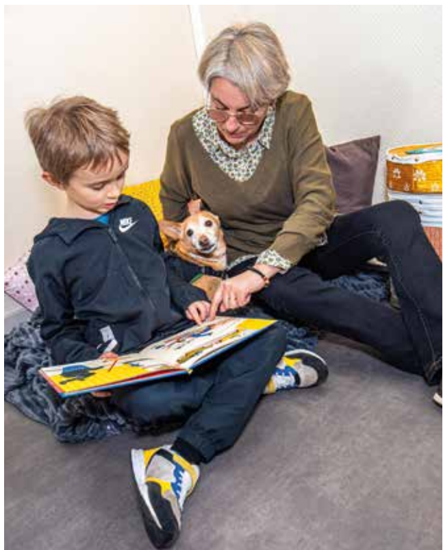
Médiation animale. Début mars, le Programme de réussite éducative proposait aux enfants une séance de lecture avec un chien, favorisant l'apaisement et la confiance en soi.