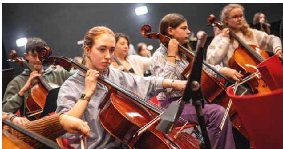
Place à la musique. 6 élèves de l'école municipale de musique ont rejoint l'Orchestre métropolitain des jeunes lors d'une semaine de stage pour préparer le concert final du 4 mai à Lille.