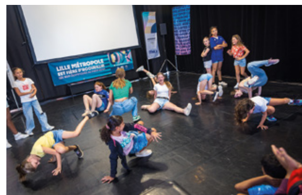
Breakdance. Nouvelle discipline aux JO, 17 jeunes se sont initiés gratuitement au breakdance cet été ; un stage qui s'est terminé par un spectacle.