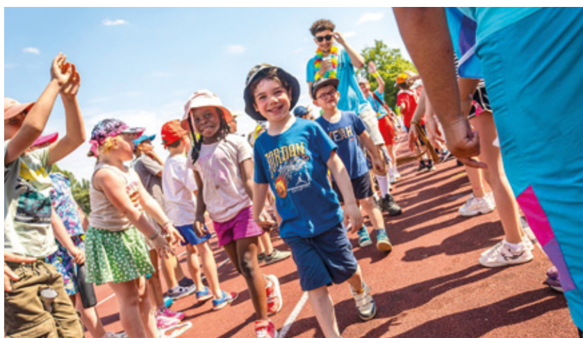
Vacances. Pas moins de 900 petites bouilles armentières ont pu vivre un été inoubliable durant les centres aérés mêlant sport, aventure et amitiés.