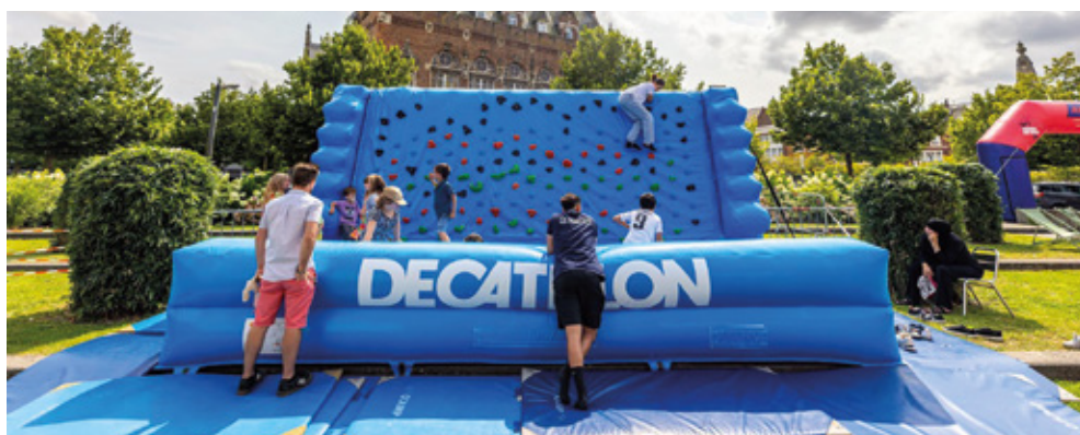
The place to be. Chaque jour pendant les Jeux olympiques de Paris, les « Terrasses des jeux » ont proposé un panel d'activités sportives à tous les Armentières(e)s sur le parvis du Vivat. Un espace incontournable de cet été qui a donné lieu à des instants de partage et de convivialité.