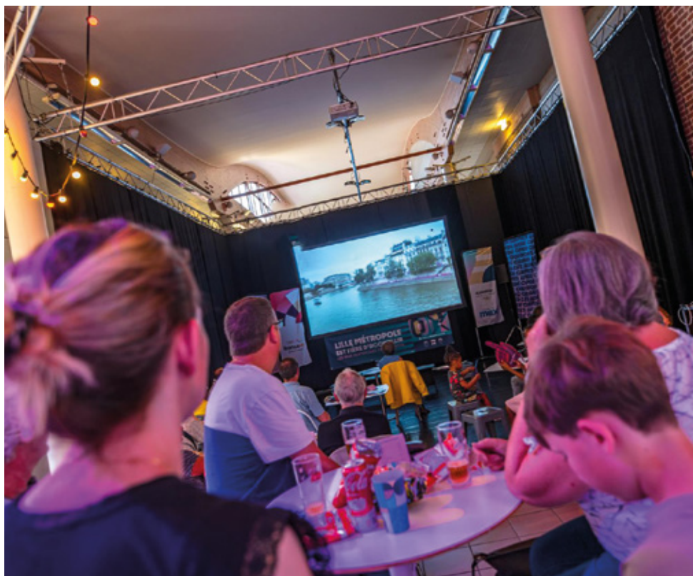
Club 2024. Cet été, à l'occasion des JO de Paris 2024, la Ville a remporté la médaille des émotions devant les épreuves des bleus diffusées en direct depuis le Vivat.