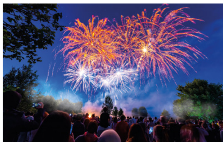
Mille couleurs. Explosion de paillettes dans le ciel de notre Ville à l'occasion de la Fête Nationale.