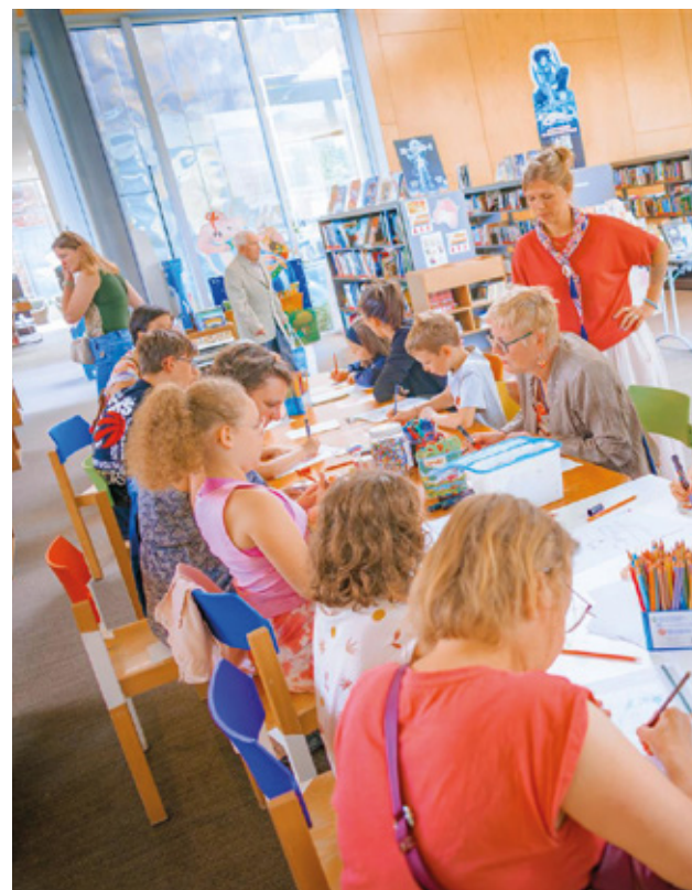
Créatif. Quand culture et sport font bon ménage à la Médiathèque, cela donne lieu à des ateliers partagés.