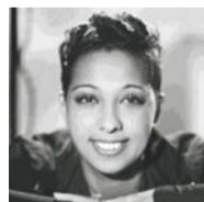
Joséphine Baker (1906 – 1975)

Issue d'une famille pauvre du Missouri, elle est repérée pour participer à une revue en France. Elle se rendra célèbre avec La Revue Nègre, à Paris,