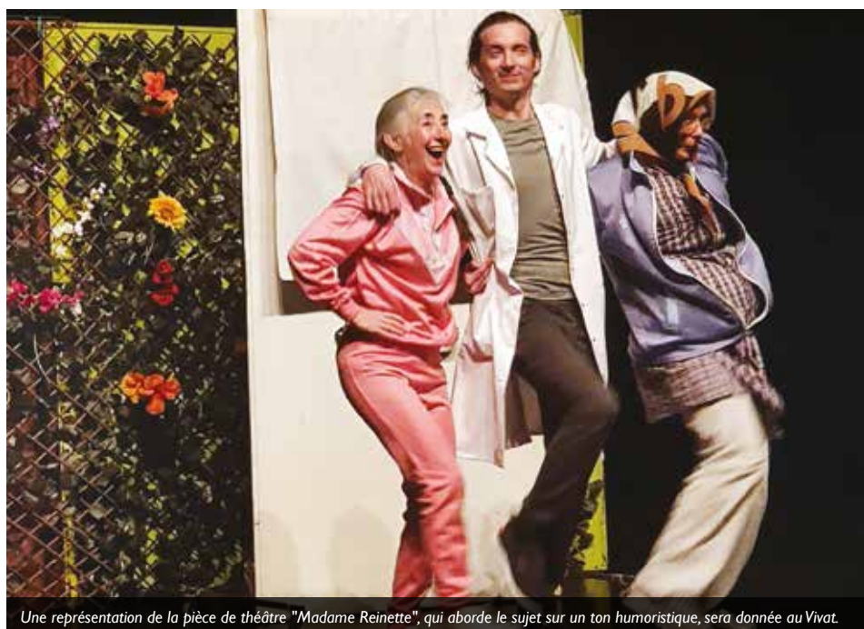
Une représentation de la pièce de théâtre "Madame Reinette", qui aborde le sujet sur un ton humoristique, sera donnée au Vivat.

> Plus d'infos et inscriptions : MAISON DES SENIORS, 57 rue Paul Bert / 03 61 76 08 57