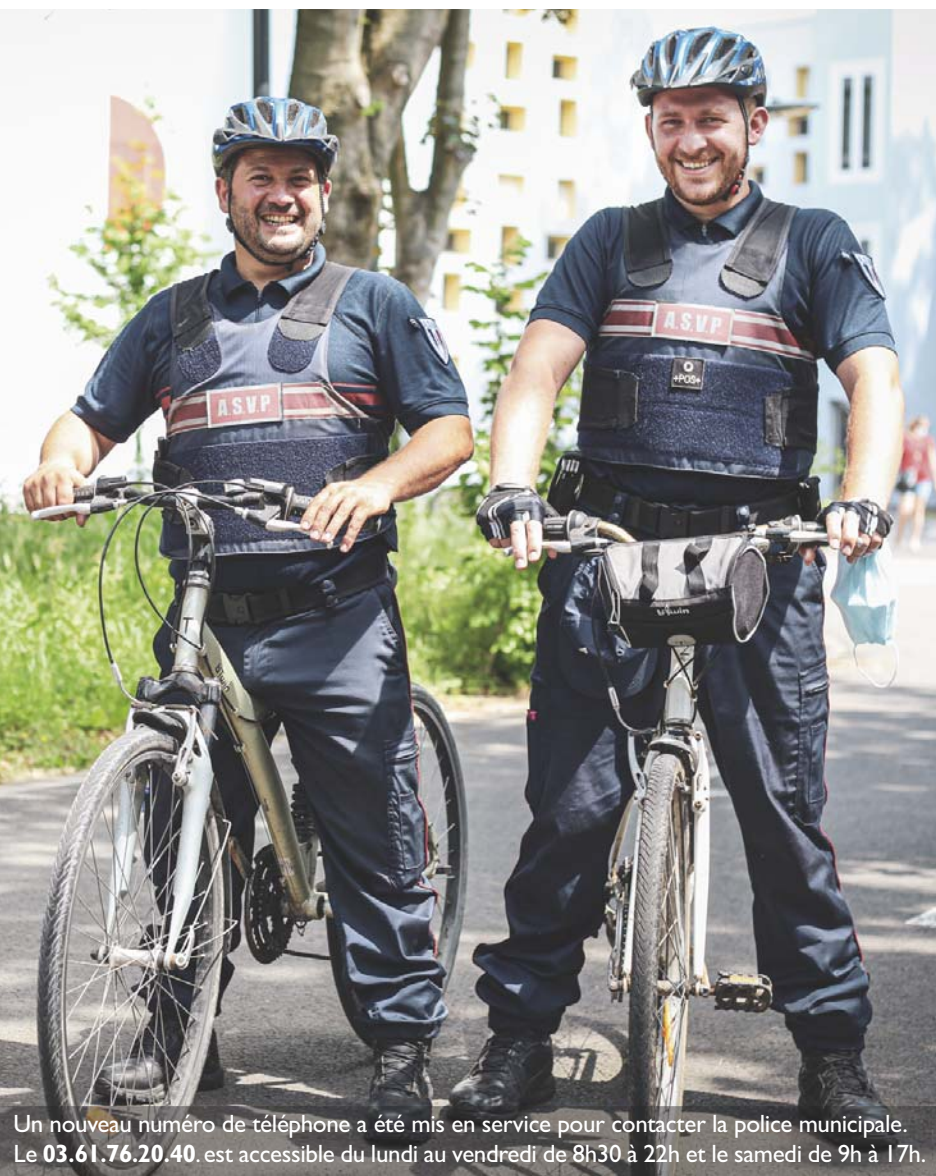
Un nouveau numéro de téléphone a été mis en service pour contacter la police municipale. Le 03.61.76.20.40. est accessible du lundi au vendredi de 8h30 à 22h et le samedi de 9h à 17h.

SERS MUNICIPAUX ET AGENTS DE SURVEILLANCE DE LA VOIE TÉ DE TOUS.