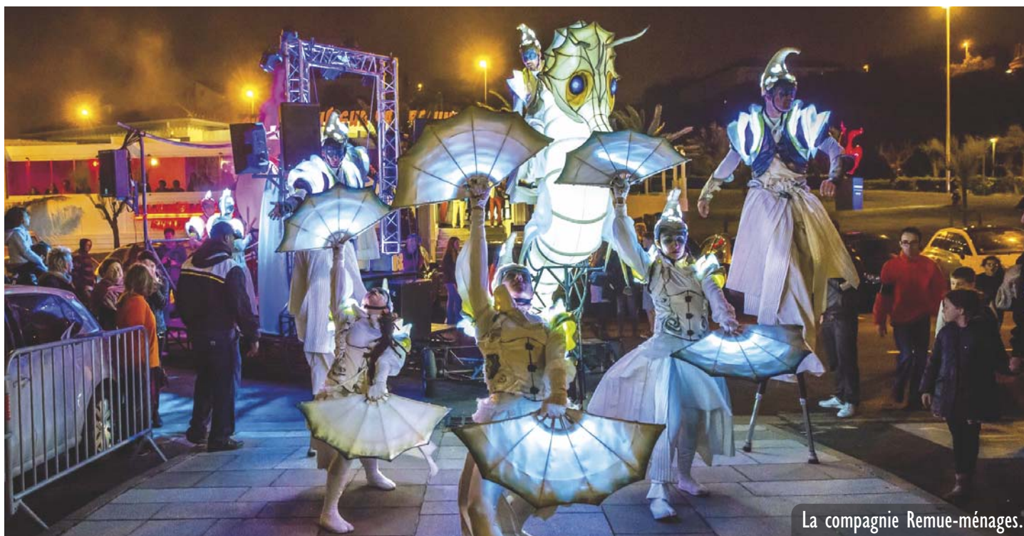
La compagnie Remue-ménages.

MARCHÉ SOLIDAIRE, PARADE DE RUE, RENCONTRE AVEC LE PÈRE-NOËL, FEU D'ARTIFICE... ON VOUS EMMÈNE DANS LA MAGIE DE NOËL !