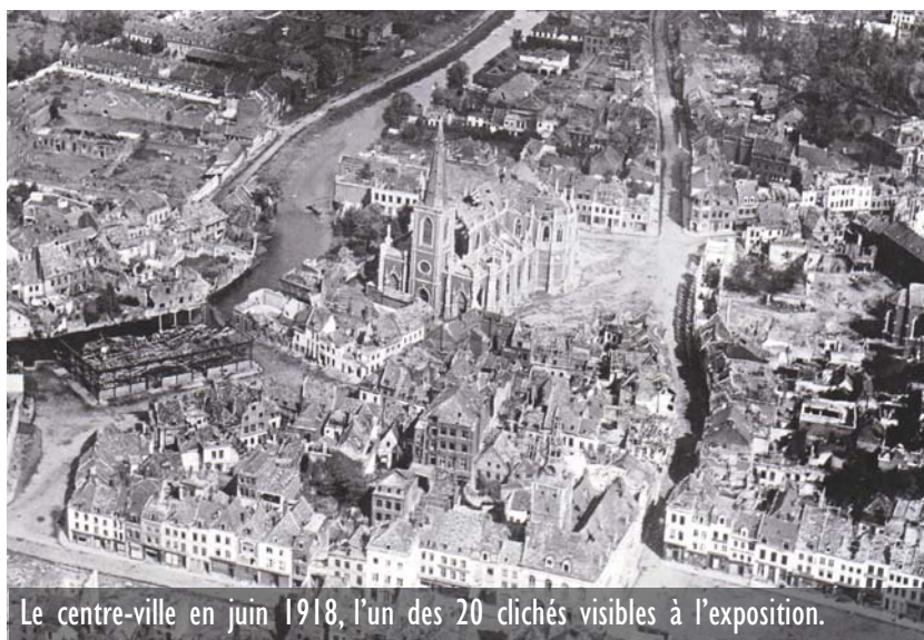
Le centre-ville en juin 1918, l'un des 20 clichés visibles à l'exposition.

> « Les batailles aériennes d'Armentières », par Les Amis de la Cité de la Toile et la Ville. Du 9 au 25 novembre à la Médiathèque.