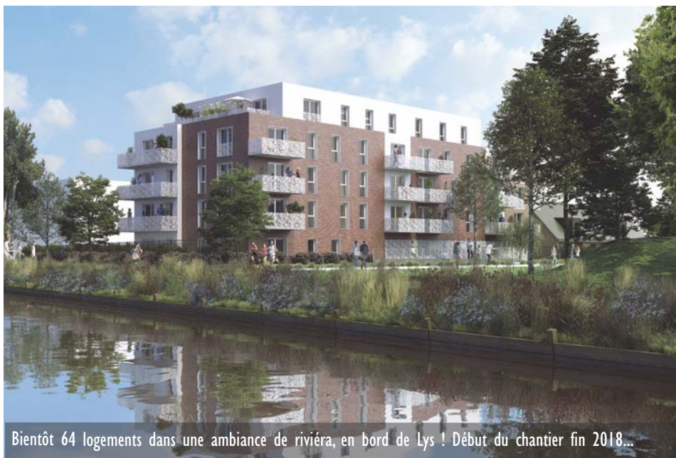
Bientôt 64 logements dans une ambiance de riviéra, en bord de Lys ! Début du chantier fin 2018...

extérieurs agréables et sécurisés... L'ensemble bénéficiera d'un cadre exceptionnel, bordé au Nord par la Lys et son chemin de halage, face aux 120 hectares de nature de la Base des Prés du Hem, à seulement quelques minutes du centre-ville. Une fois n'est pas coutume, pas de locatif ici, mais de l'accession aidée à la propriété (sous condition de ressources). Commencée fin 2017, la commercialisation est toujours en cours.