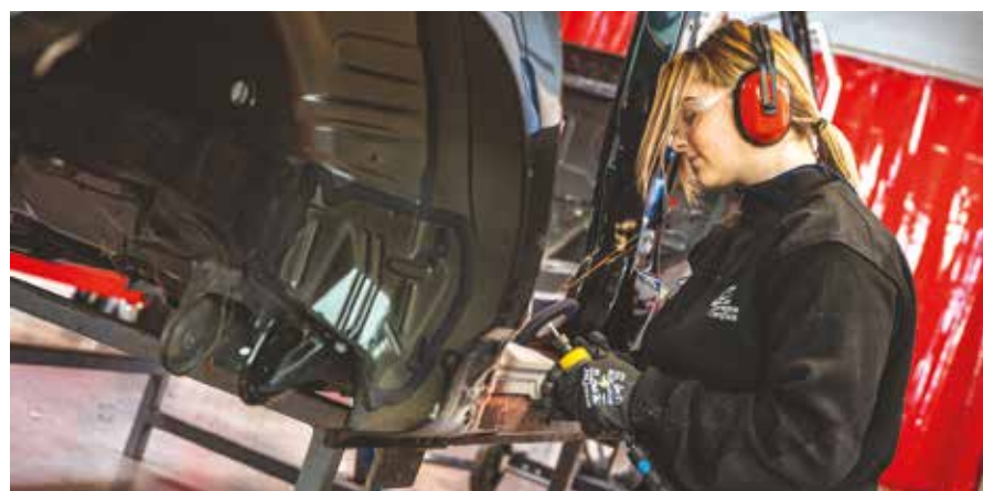
Les sélections régionales des WorldSkills se sont déroulées à l'institut Nicolas Barré. Parmi les lauréats, 3 élèves de l'établissement armentériois représenteront la Région aux finales à Lyon, en septembre.