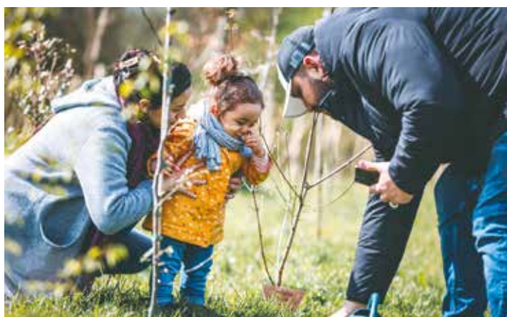
En avril, la deuxième forêt urbaine située près de l'étang bleu a été inaugurée. Des petits Armentériois nés en 2021 sont venus arroser leur arbre en y apposant une plaque personnalisée.