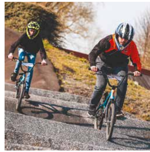
On s'éclate à l'ERJ ! Les jeunes s'initient à la pratique du BMX durant les vacances scolaires d'avril.