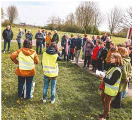
Une journée organisée au jardin des Portes de France pour envisager l'avenir du lieu en collaboration avec les habitants.