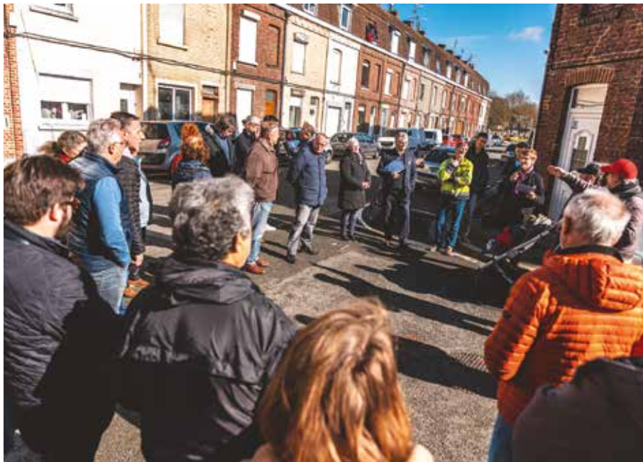
Les habitant(e)s du quartier Saint-Roch se sont rendus au diagnostic en marchant proposé par la municipalité afin d'aménager les espaces publics en tenant compte des usages de chacun(e).