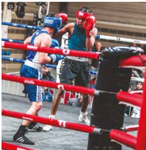
Échanges musclés le samedi 8 avril sur le ring de boxe anglaise devant un public retenant son souffle !