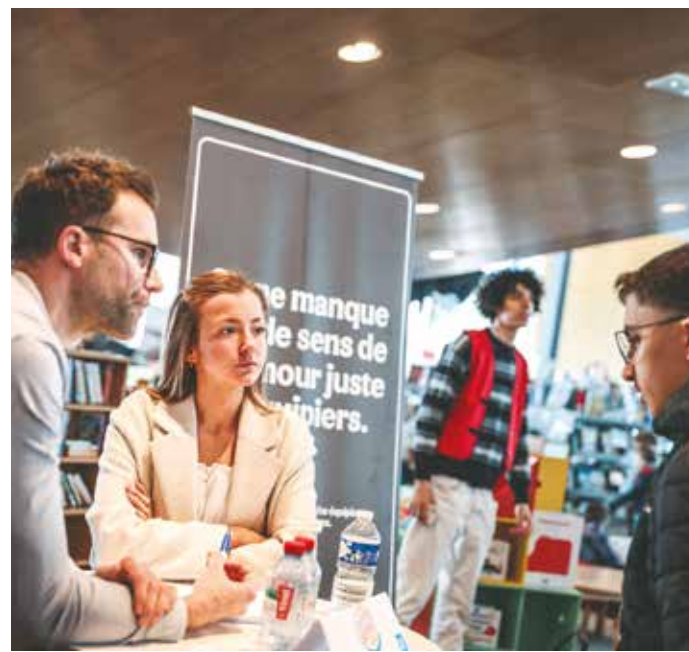
L'événement Yadutaf pour tous le 12 avril dernier permettait aux entreprises de rencontrer des centaines de postulants dans une ambiance conviviale à la Médiathèque.