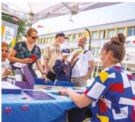
Écologie et économies. Les événements Armentières on sème et l'Écoday ont proposé au public le 7 juin, une après-midi autour de l'écologie et des éco-gestes.