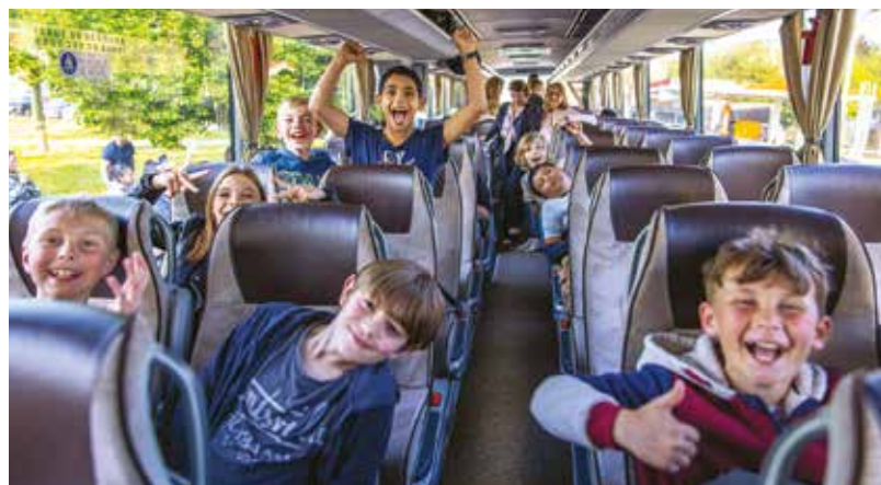
Un air de vacances. Les élèves de l'école Gambetta sont partis en classe d'environnement à Saint-Léger-les-Mélèzes du 30 mai au 9 juin. Souriants au départ comme à leur retour !