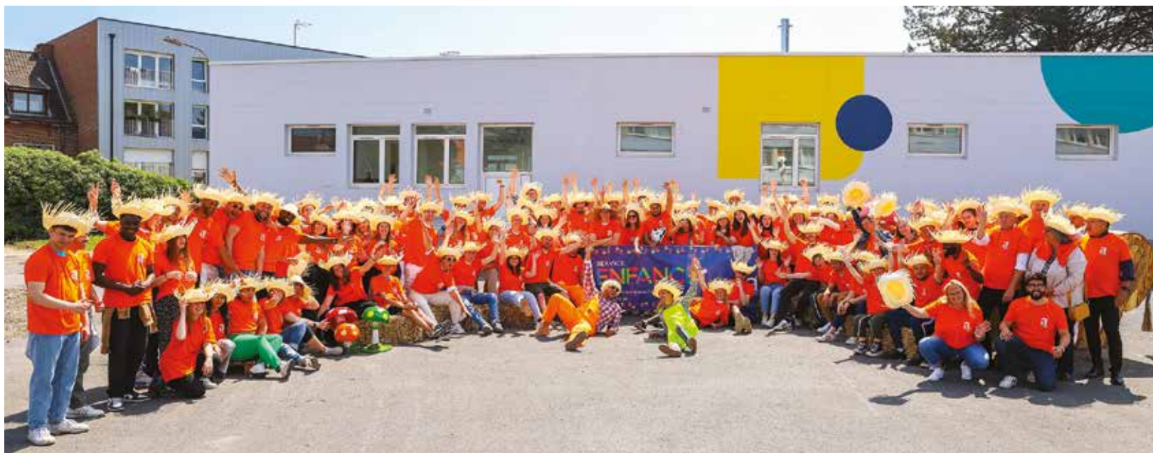
Un été à la ferme. Les animateurs des accueils de loisirs se sont réunis le 27 mai lors d'une journée d'intégration pour finaliser la programmation estivale qui aura pour thème « La ferme en folie ». Les enfants ne vont pas s'ennuyer...