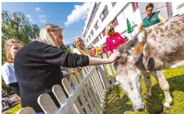
Médiation animale. L'association Les Blouses roses d'Armentières a offert une séance de câlinothérapie aux résidents du Pôle gériatrie du Centre hospitalier : papouilles et caresses illimitées.