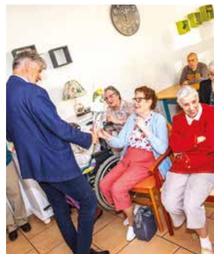
Bonne fête des mères. Le 3 juin, le Maire et les Élus ont rendu visite aux mamans hospitalisées.