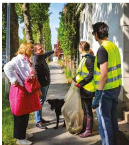
Clean up day. Les habitants et associations se sont joints aux agents pour une journée de nettoyage de la Ville le 27 mai.